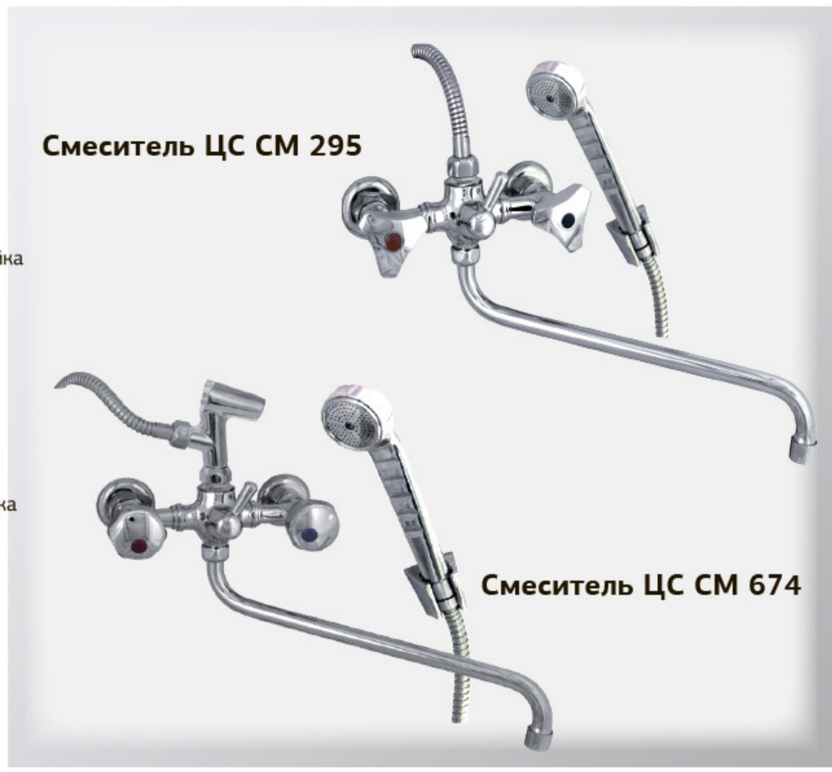
Смеситель ЦС СМ 295