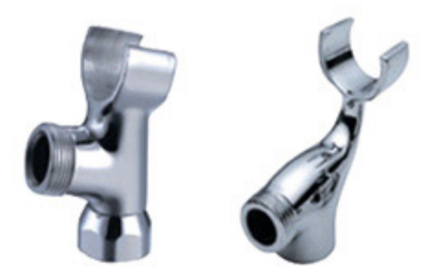
Стойка - держатель лейки на корпусе смесителя (смеситель ЦС СМ 674) стойка - телефончик

смесители могут иметь различное защитно-декоративное покрытие