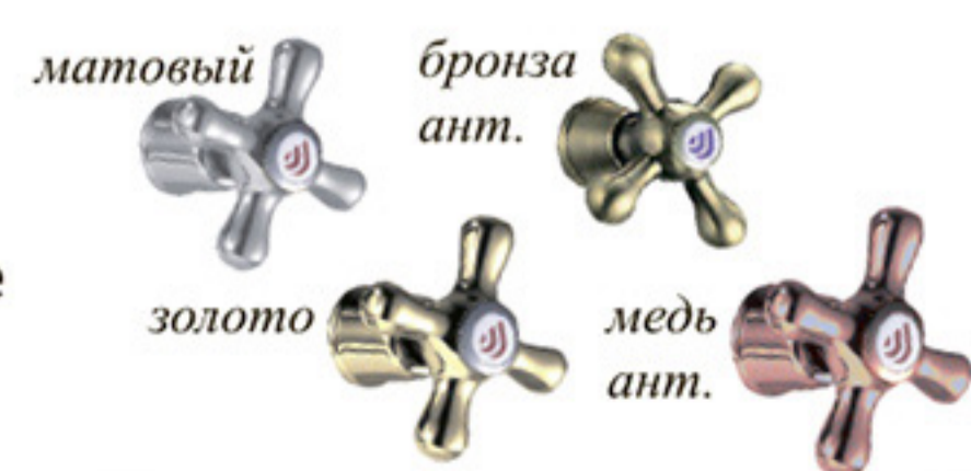
Варианты покрытия корпуса

смесители могут иметь различное защитно-декоративное покрытие